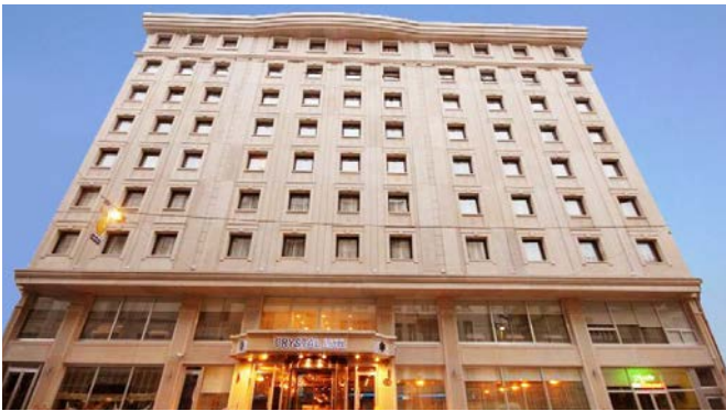
CRYSTAL HOTEL ★★★★★