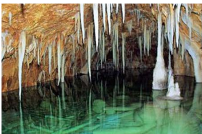
ALANYA DAMLATAŐ MAĐARASI