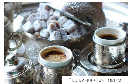
TÜRK KAHVESİ VE LOKUMU