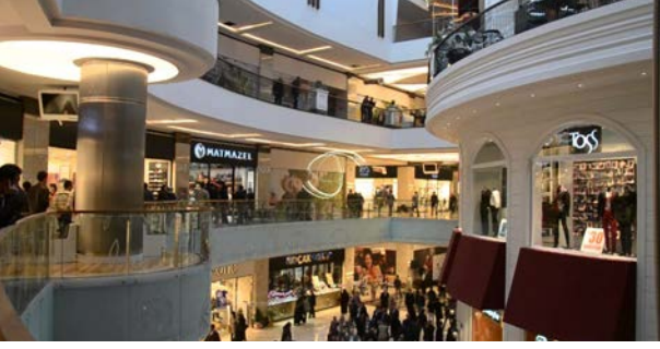
KENT PLAZA AVM