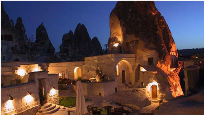
PERI CAVE OTEL