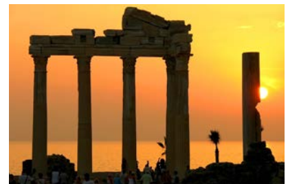
APOLLON TAPINAĐI - SIDE ANTİK KENTİ