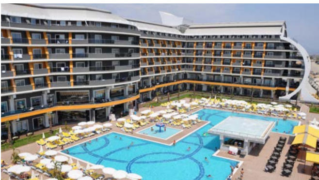
SENZA THE INN RESORT