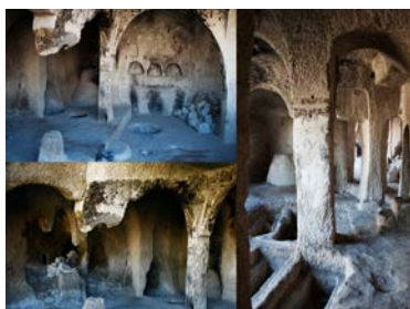
SILLE ANTİK KENTİ