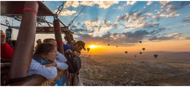
KAPADOKYA BALON TURU