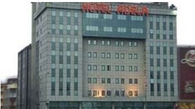
ADELA HOTEL ★★★★★