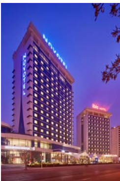
NOVOTEL - İBİS HOTEL