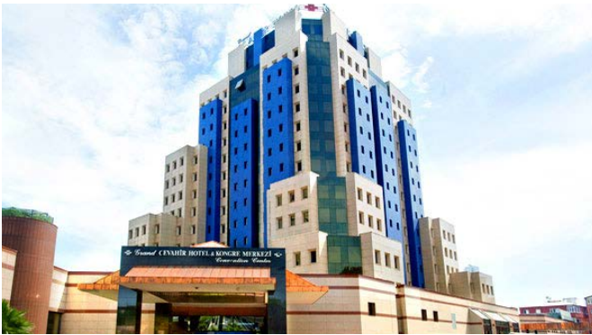
GRAND CEVAHİR HOTEL ★★★★★